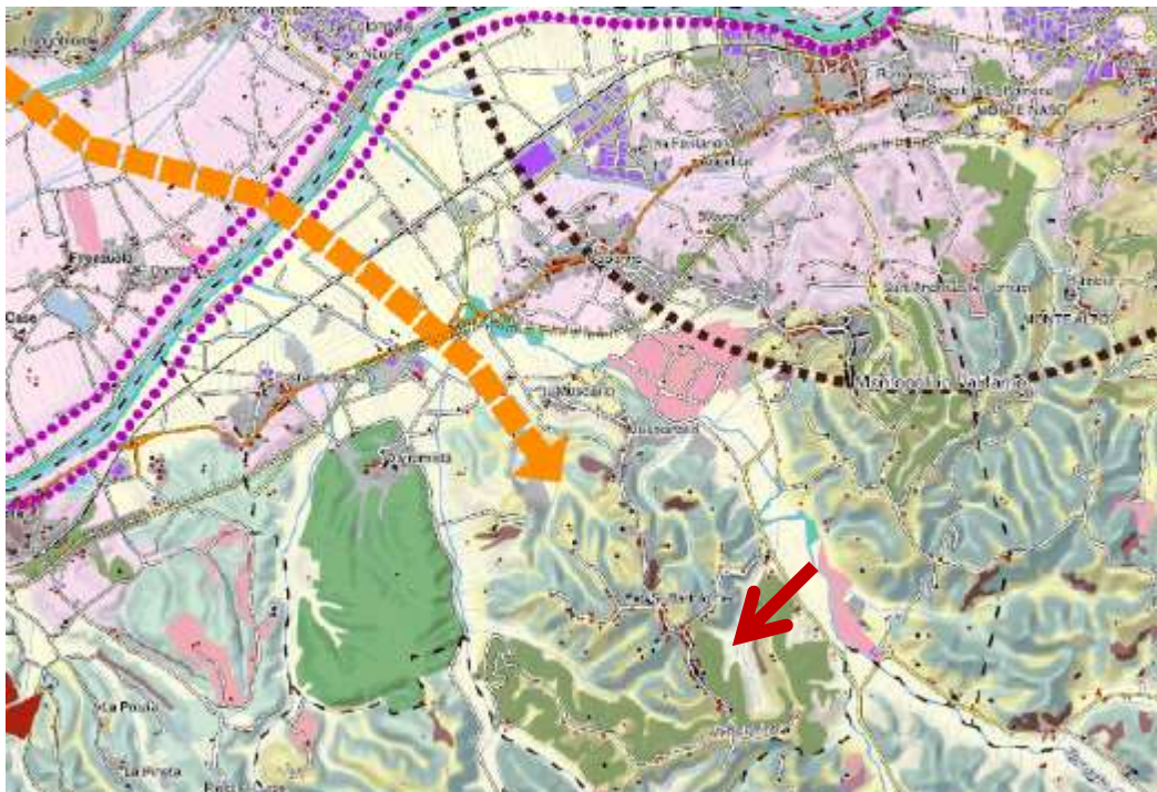
ESTRATTO DAL PIT REGIONE TOSCANA CON VALENZA DI PIANO PAESAGGISTICO

Nelle immediate vicinanze sono presenti la SGC FI-PI-LI, la ferrovia Pisa-Firenze, costituenti un forte impatto territoriale, ecologico e paesaggistico. Tuttavia il cono visivo prospiciente alle diverse angolazioni dell'area fa emergere un tessuto paesaggistico di pregio, di chiara connotazione tradizionale Toscana, con gradevole diversificazione e complessità agro-ecosistemica, legata anche ad isolate emergenze architettoniche che ne hanno favorito la promozione turistica.